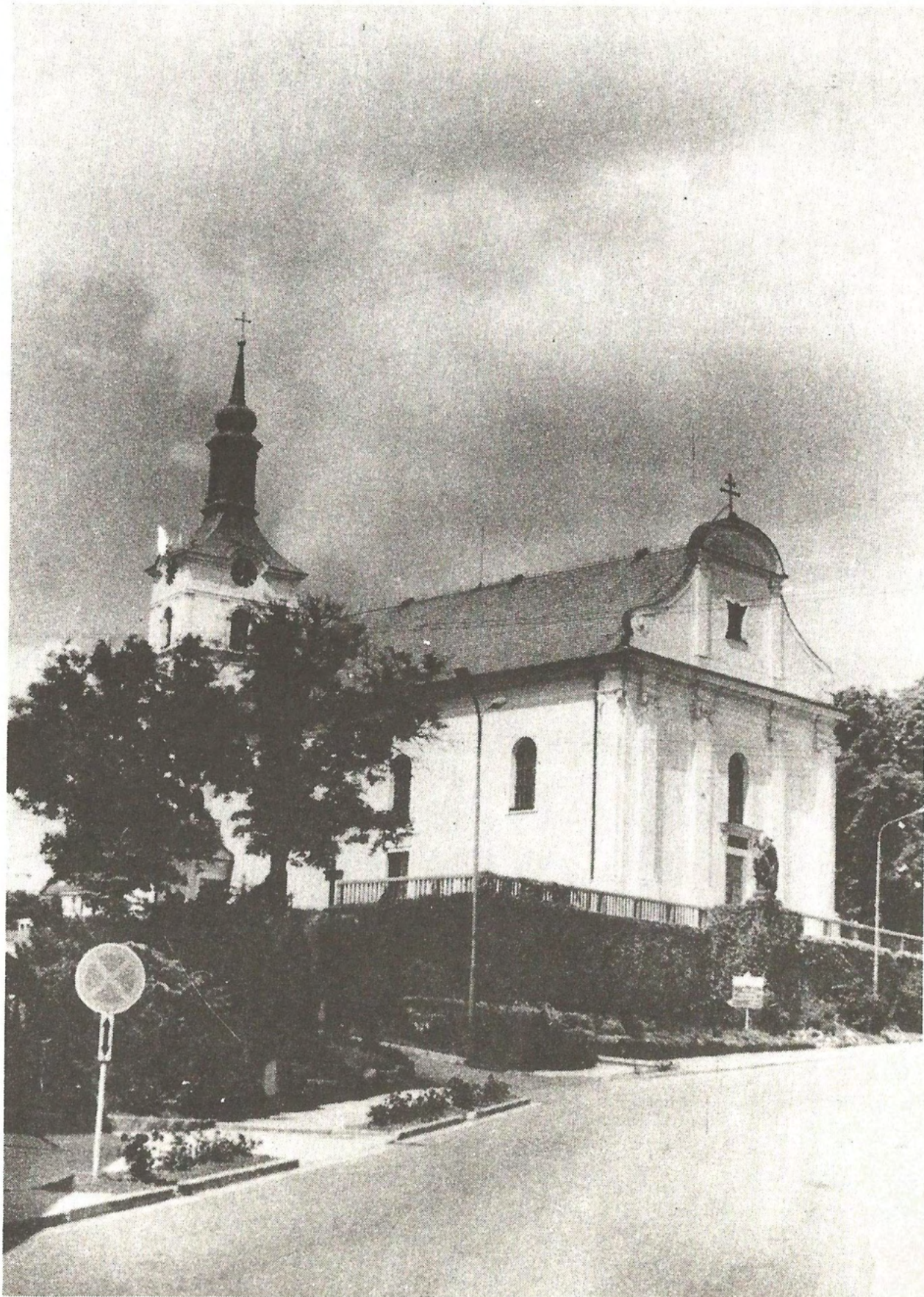
Farní kostel v Olešnici na Moravě