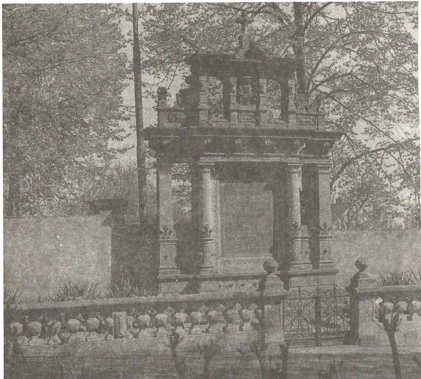
Společná hrobka O. augustiánů na ústředním hřbitově v Brně