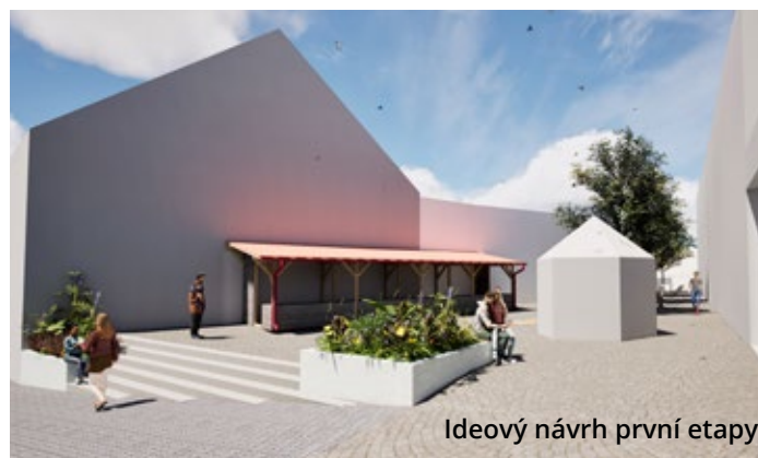
Ideový návrh první etapy

Rekonstrukce tržnice je dalším krokem v dlouhodobém úsilí města o kultivaci veřejných prostranství a vytvoření kvalitního prostředí pro každodenní život.