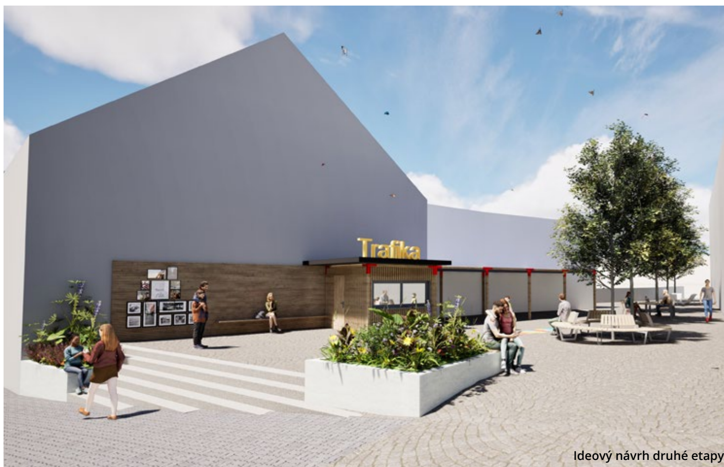
Ideový návrh druhé etapy

Městská tržnice v Olešnici projde zásadní proměnou. Stávající podoba prostoru, který je dnes uzavřený a obehnaný plotem, již neodpovídá současným potřebám ani představám o funkčním a živém městském prostředí. Město se proto rozhodlo pro rekonstrukci, která vznikla ve spolupráci s architektem Štěpánem Hirschem.