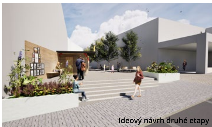
Ideový návrh druhé etapy

Součástí druhé etapy je také přesunutí trafiky ke štítu