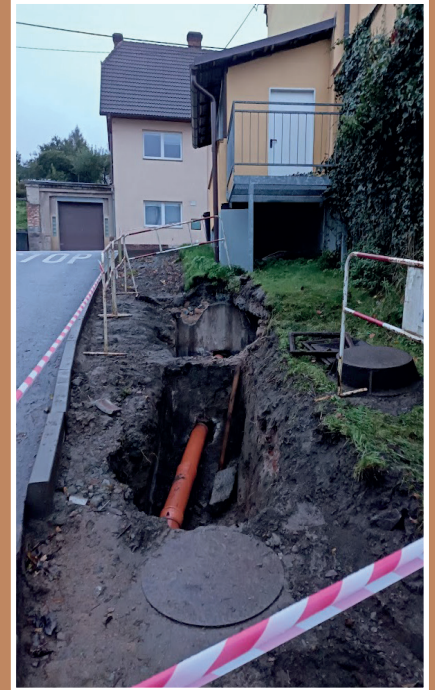
Odkanalizování lékařského střediska