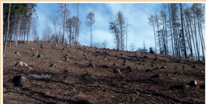
Nová výsadba na ulici Družstevní