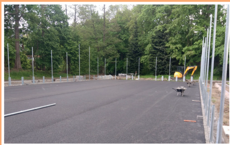
Podkladová vrstva vodopropustného asfaltu víceúčelového hřiště