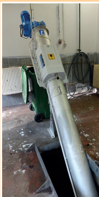
Výměna česlí za zařízení Huber na ČOV