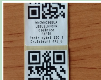
Zavedení QR kódů pytlového svozu