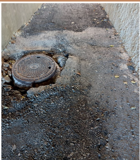
Úprava kanalizace v uličce u hotelu