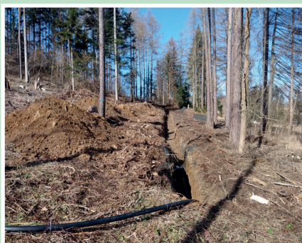
Propojení nového vrtu na vodojem - výkop v lese