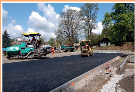
Výstavba doskočiště na atletickém areálu