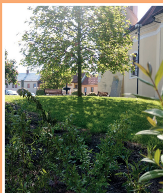
Výsadba zeleně na náměstí