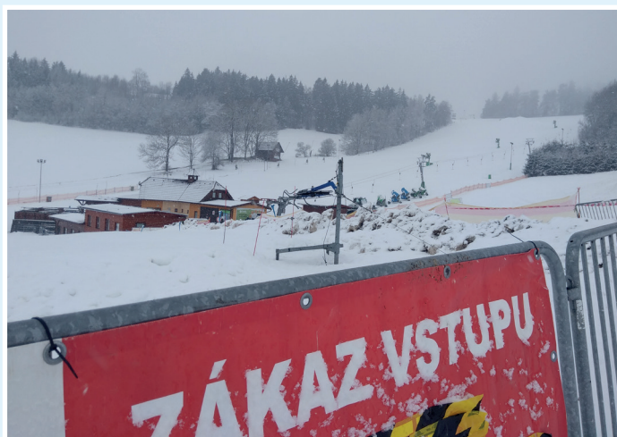
Prázdný skiareál po zákazu provozování - protiepidemické opatření vlády