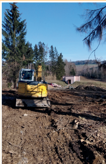
Úprava terénu po položení potrubí k vodojemu