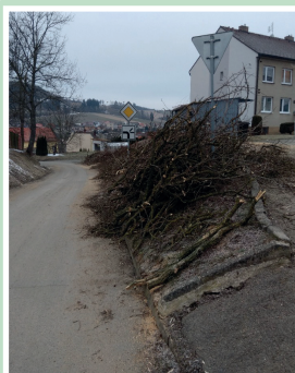
Kácení akátů na ulici Družstevní