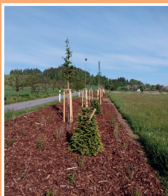
Výsadba oddělující zeleně lokality Piskačův sad