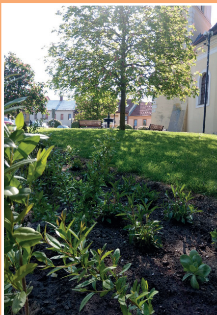
Pruh keřů a trvalek na náměstí