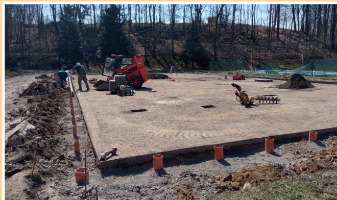
Úklid Skalek mylívci a hasiči