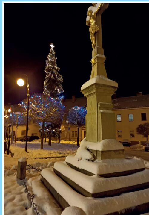
Zářivá krása stromů