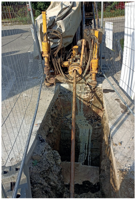
Vodovod Za Puchárnou - poslední ulice se dočkala