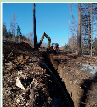
Propojení nového vrtu na vodojem - výkop