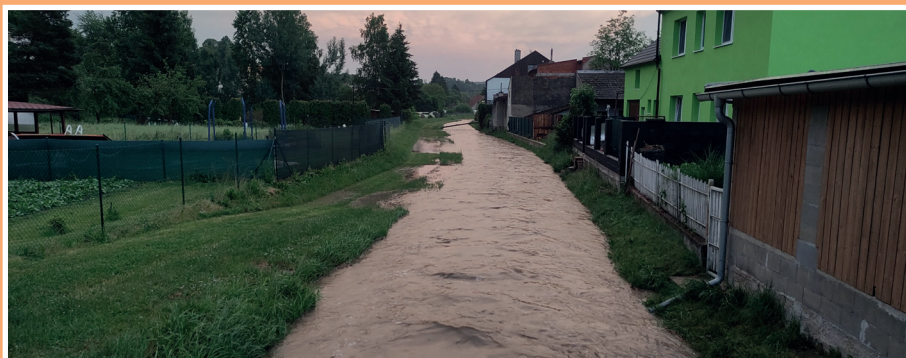
Upravené koryto Hodonínky zvládá i velké průtoky