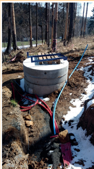
Připojení nového vrtu

Atletický areál - základy oplocení hřiště