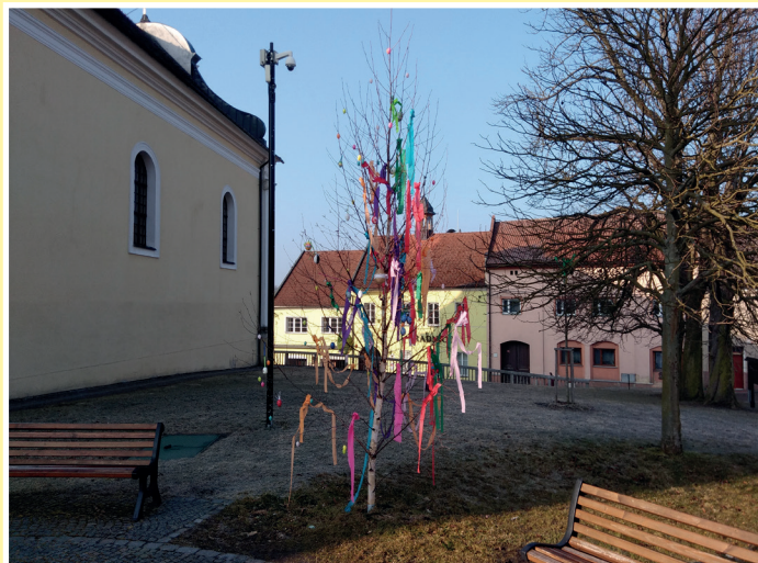
Velikonoce - alespoň pomlázkový strom u kašny