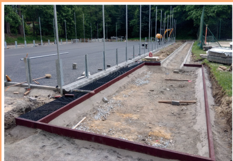
Výstavba oplocení víceúčelového hřiště