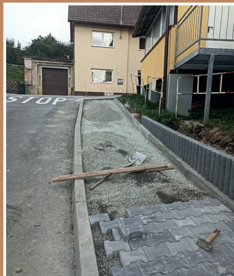
Výstavba chodníku v ulici Na špitále