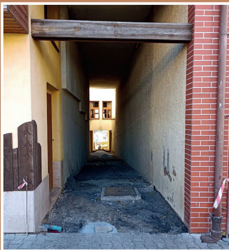
Ulička mezi náměstím a Vejpuškem před novou dlažbou