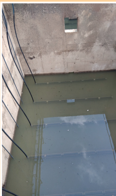
Výměna provzdušňovacího systému na ČOV